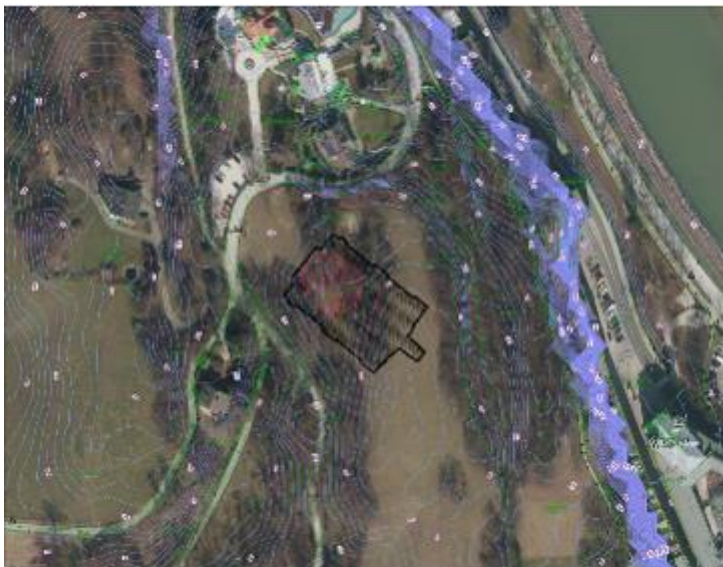
Das Mozart-Festspielhausprojekt am Mönchsberg 1890 (Atelier Fellner & Helmer, Wien) für 1500 Personen sollte auf der Wiese zwischen heutigem Museum der Moderne und heutigem Schlosshotel Mönchstein entstehen. (Rot schraffiert der gesamte Bühnenbereich)

Das Interesse der Menschen für die Idee der Festspielhaus-Vision am Mönchsberg soll im Vorbeigehen geweckt werden. Eine verworfene Idee wird zum Kunstobjekt, die dreiteilige Skulptur transformiert die Vision in das Festspiel-Jubiläumsjahr 2020.