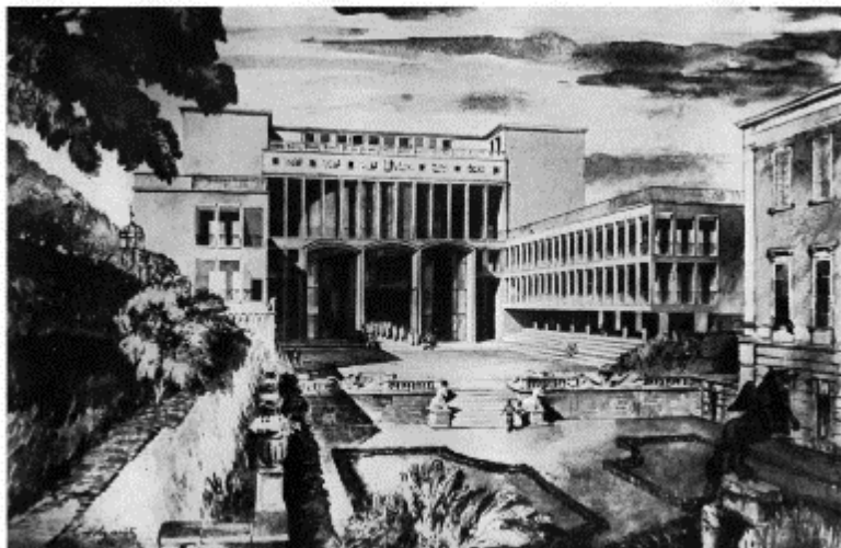
96 Projekt eines neuen Festspielhauses für Salzburg: Außenansicht mit offener Bühne gegen den Mirabellgarten Project of a new Festival Theatre at Salzburg: Dash view with Stage opening onto the Mirabell Garden

Clemens Holzmeister rückte beim Musik-Olympiaden-Projekt (1950/51) über die verglaste Bühnen-Rückwand die Festung Hohensalzburg ins Geschehen. Der dominante Bühnenturm bildet mit den niedrigeren Gebäudeflanken einen sich zum Mirabellgarten öffnenden Hof, eine „Freilichtbühne“ in Erweiterung der Bühne. © Joseph Gregor, Clemens Holzmeister 1953, S. 42