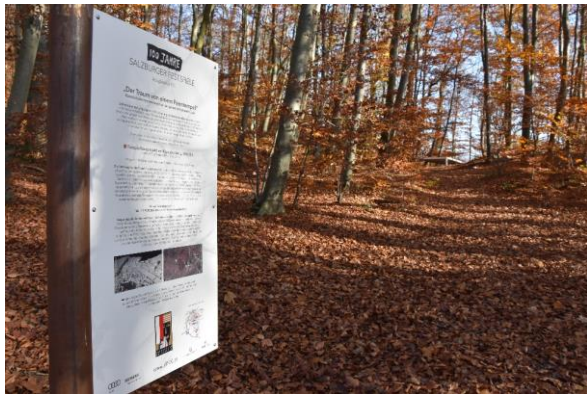
Salzburgs Stadtberge strahlen in der Wintersonne

Ein winterlicher Spaziergang durch die Festspielgeschichte auf den Salzburger Stadtbergen