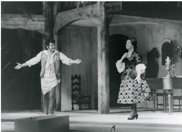
Gioachino Rossini Il barbiere di Siviglia (1968) Hermann Prey, Malvina Major