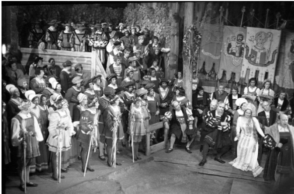
Richard Wagner Die Meistersinger von Nürnberg (1937)