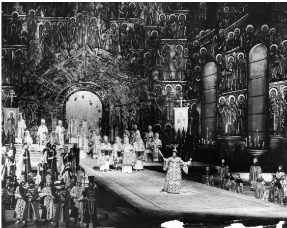
Modest Petrowitsch Mussorgski Boris Godunow (1965) Nicolai Ghiaurov